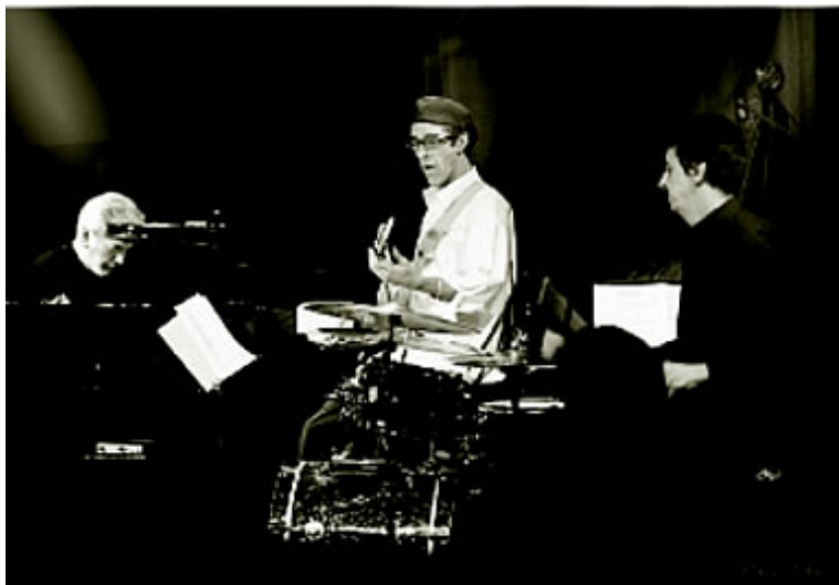
Show em Nova Iorque, Cesar Camargo Mariano Trio

O Projeto 'Cesar Camargo Mariano Convida 3' realizará 2 apresentações com as participações de 2 artistas nesta primeira edição: