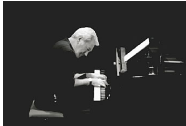
Show em Nova Iorque, Cesar Camargo Mariano

A parceria de Cesar com diversos importantes cantores nacionais, em especial Wilson Simonal e Elis Regina, lhe garantiu reconhecimento internacional. O histórico álbum "Elis e Tom", realizado com Antonio Carlos Jobim, apresenta Cesar como arranjador, pianista e diretor musical. Desde então, Cesar - agora residente nos Estados Unidos - tem trabalhado com uma gama de músicos internacionais, desde Yo-Yo Ma a Blossom Dearie. Ademais compôs uma substancial produção de trilhas sonoras para filmes e produções televisivas.